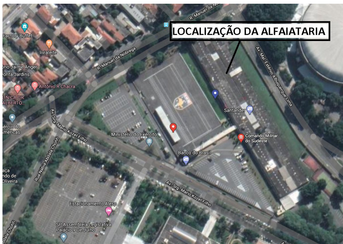
Figura 1 – Localização do Avaliando

Parcela de 24,13 m 2 do imóvel SP 02-0142, a qual corresponde a uma sala destinada à atividade de alfaiataria, para atender ao público interno do Quartel General do Ibirapuera. A área destinada à alfaiataria compreende a parcela destacada da Figura 1.