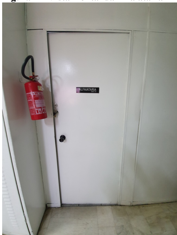
Figura 2 – Vista frontal da Alfaiataria